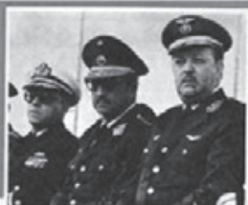
DIALOGO SUPONE IGUALDAD SIN TUTELAS