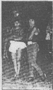
Fotografía de Pucallpa, Perú.

Se refirió a la situación de violencia que se está viviendo en la zona de Pucallpa, donde se han cometido crímenes contra «gays» que se atribuyen al MRTA.