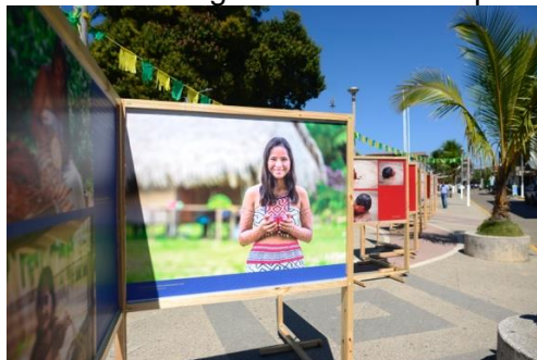
Imagen referencial de panel