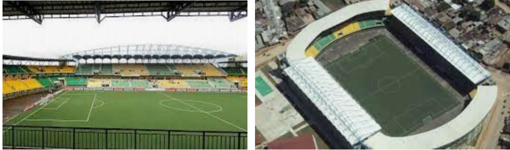
Imagen referencial del Estadio Aliardo Soria