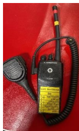
Modelo de auricular tipo cobra