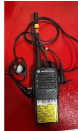
Modelo de articular tipo clip y orejera