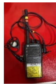
Modelo referencial de articular tipo clipy orejera.