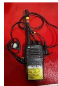
Modelo referencial de articular tipo clip orejera.