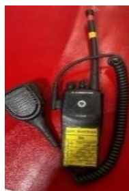
Modelo referencial de auricular tipo cobra.