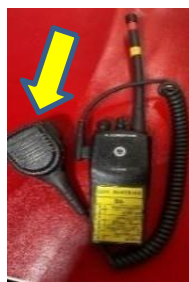
Modelo referencial de auricular tipo cobra.