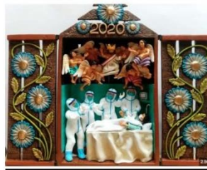
Retablo - Imagen referencial