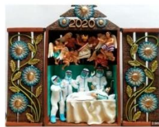
Retablo - Imagen referencial