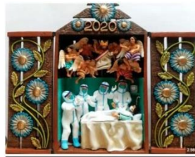
Retablo - Imagen referencial

Firmado digitalmente por DE LOS RIOS DE SOUZA PEIXOTO Vanessa FAU/20537630222.soft Motivo: Doy V° B° Fecha: 19.08.2024 17:24:31 -05:00