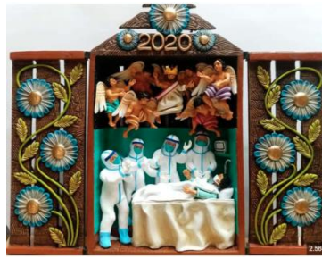
Retablo - Imagen referencial