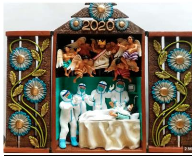
Retablo - Imagen referencial