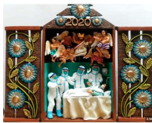
Retablo - Imagen referencial